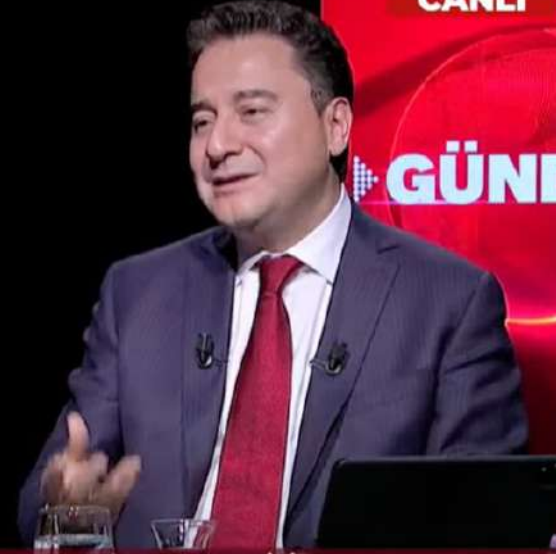
ALİ BABACAN / DEVA PARTİSİ GENEL BAŞKANI