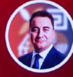
KONUŞMACI ALİ BABACAN DEVA Partisi Genel Başkanı