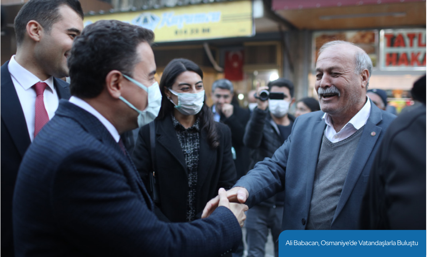
Ali Babacan, Osmaniye'de Vatandaşlarla Buluştu

"AK Parti iktidarı, cumhuriyet döneminde yapılmayanları yapmakla övünüyordu. Evet, 'hayaldi gerçek oldu.' Boğaz Köprüsü'nü rahmetli Demirel, Fatih Sultan Mehmet Köprüsü'nü de rahmetli Özal inşa etmişti. Her ikisinin akıl edemediğini Sayın Erdoğan icat etti."