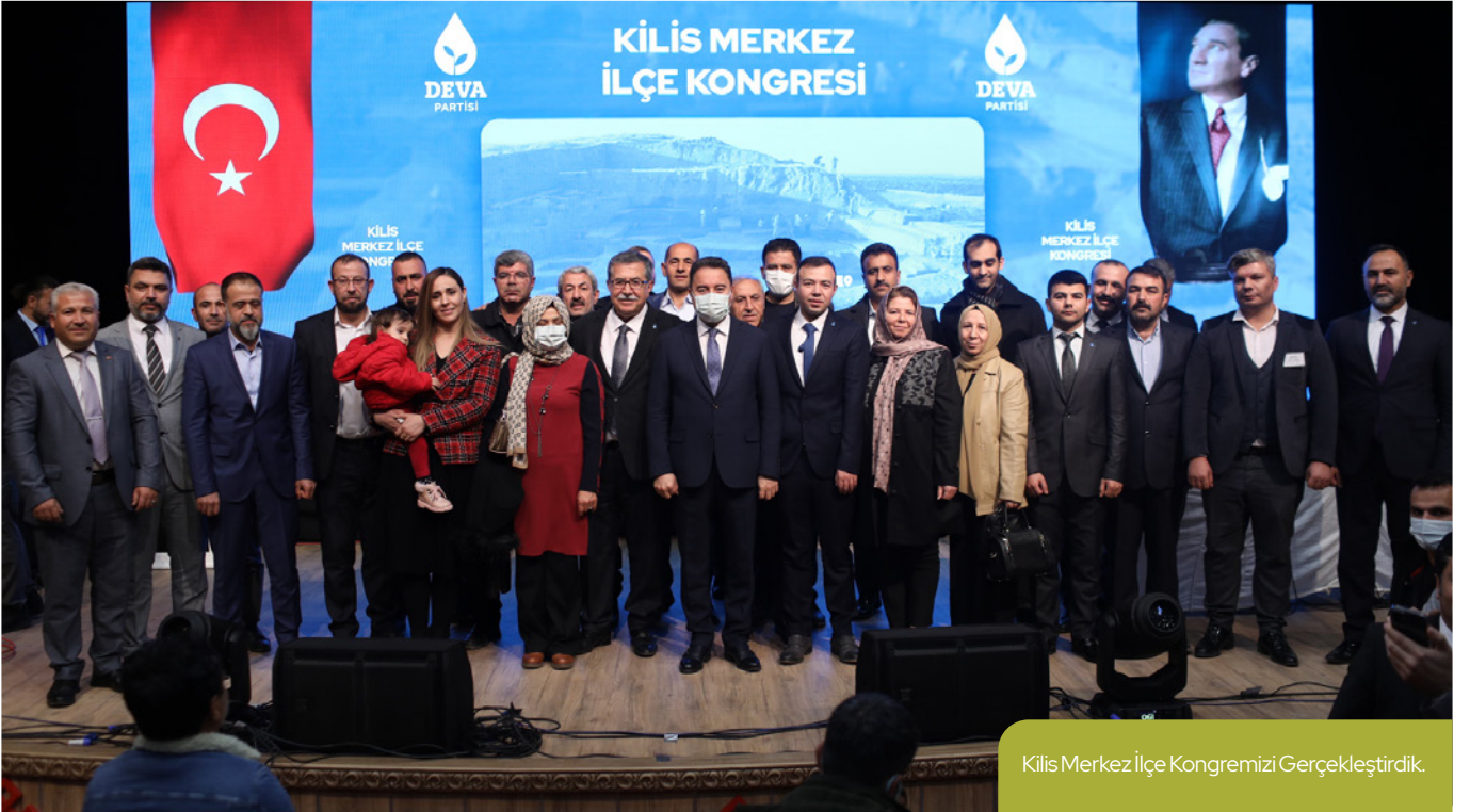
Kilis Merkez İlçe Kongremizi Gerçekleştirdik.

"Sizin hiç mi kabahatiniz yok? Otoyol ve köprü projelerinde olduğu gibi enerji sektöründe de alım garantilerini dolara endekli yapan kim? Hükûmet. Ekonomiye kötü yöneterek Türk lirasının bir yılda yüzde 80 değer kaybetmesine ve maliyetlerin artmasına neden olan kim? Hükûmet. Doğal gazın 1000 metre küpü 250 dolarken yeni anlaşma için masaya oturmayan, 1200 dolara yükselmesini bekleyen kim? Hükûmet. Piyasayı bozan, yatırım ortamını kötüleş-tiren kim? Yine hükûmet. Kimse sorumluluğu başka yerde aramasın."