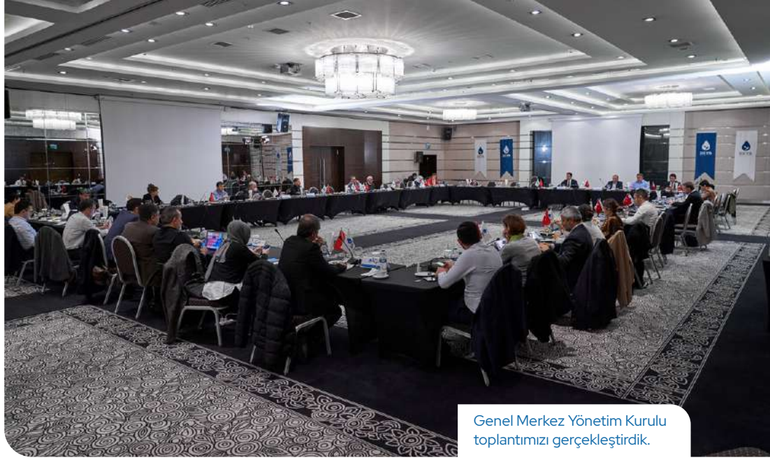
Genel Merkez Yönetim Kurulu toplantımızı gerçekleştirdik.

“Yargı uzunca bir süredir bağımsızlık ve tarafsızlığını kaybetmiştir. Son beş yılda siyasi casusluk iddiasıyla yürütülen soruşturmaların hiçbiri kamuoyu vicdanını tatmin etmemiştir. Bundan önceki casusluk suç tipine ilişkin dosyaların tamamına yakınının beraatla so-